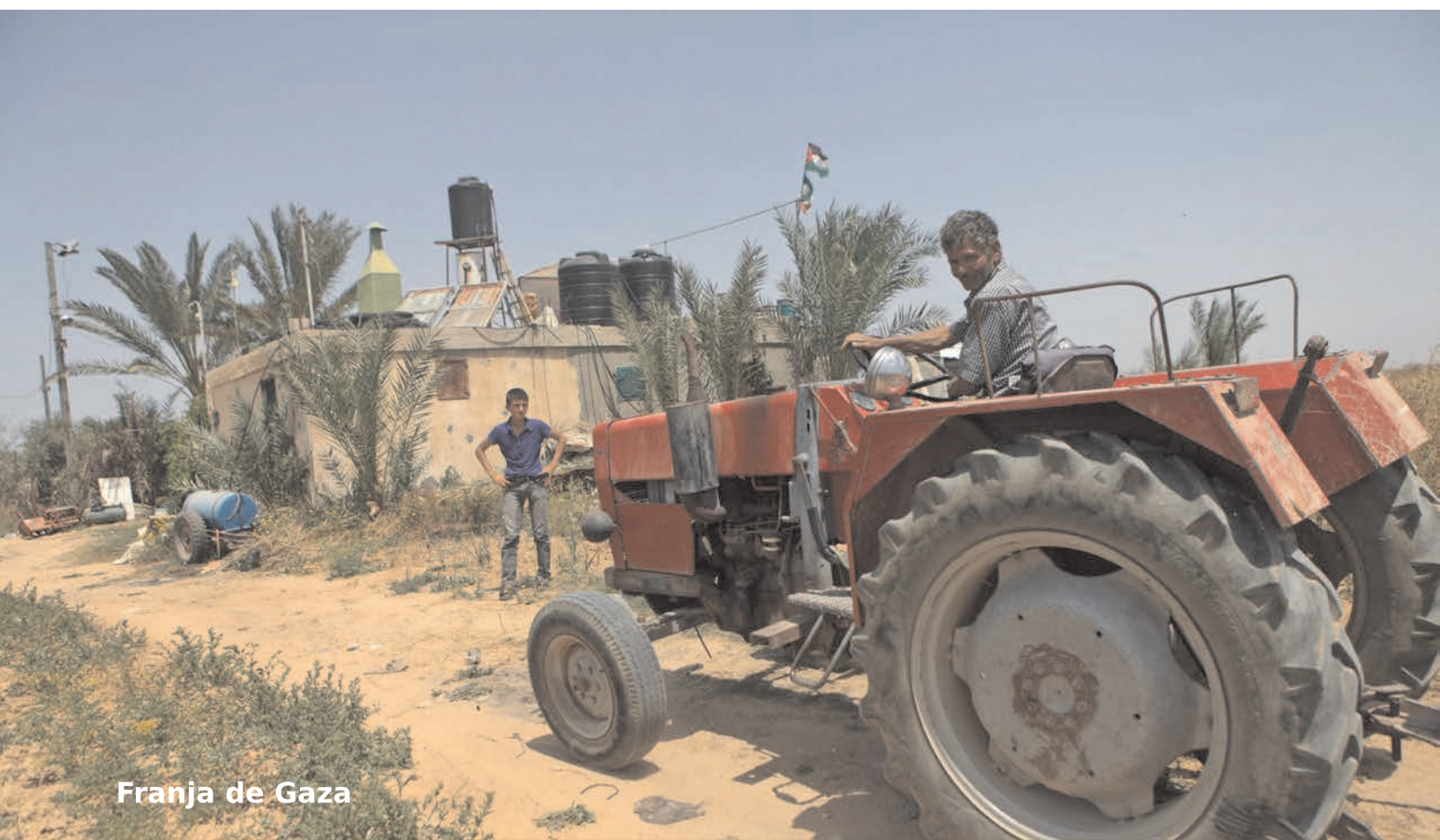
Franja de Gaza

El boicot a los productos agrícolas israelíes, así como el llamado a boicotear el comercio agrícola con Israel, son otras estrategias de largo plazo adoptadas por los campesinos palestinos y las organizaciones que les apoyan. Por otra parte, muchas organizaciones palestinas se dedican a apoyar la presencia de los campesinos palestinos en sus tierras, a defender sus derechos y a movilizarse junto a ellos. En este sentido, estas organizaciones de la mano con otras de la sociedad civil palestina, forman parte de la resistencia continua a las políticas israelíes y las violaciones de los derechos de los campesinos.